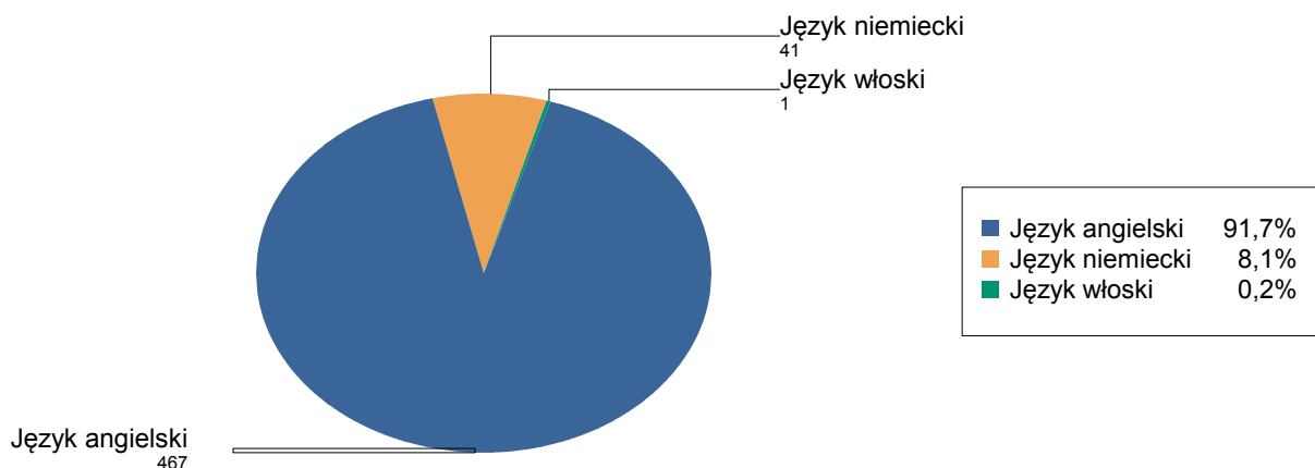
Wykres 1. Wybieralność języków obcych nowożytnych na pisemnym egzaminie maturalnym zdawanym jako przedmiot obowiązkowy przez absolwentów wszystkich szkół w powiecie