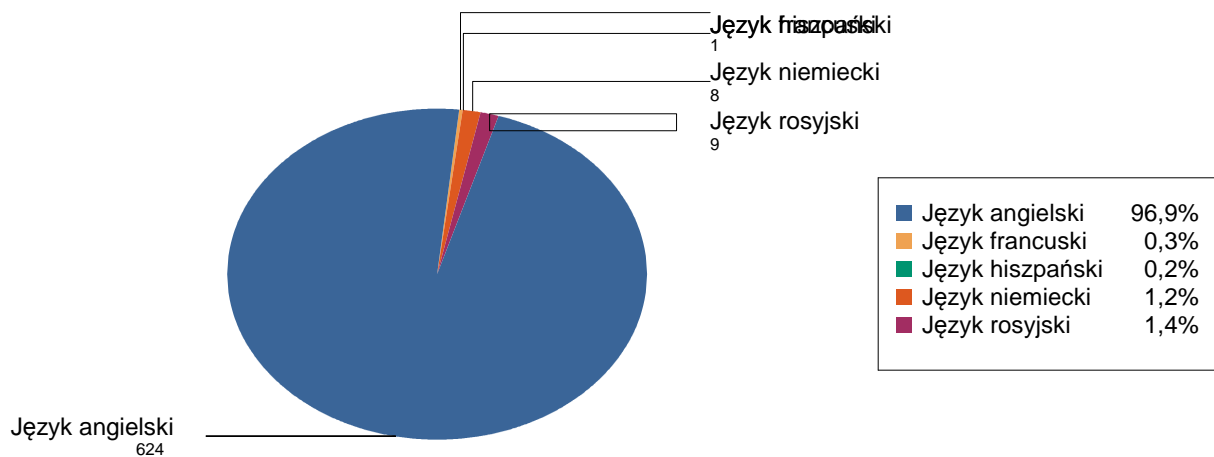
Wykres 1. Wybieralność języków obcych nowożytnych na pisemnym egzaminie maturalnym zdawanym jako przedmiot obowiązkowy przez absolwentów wszystkich szkół w powiecie